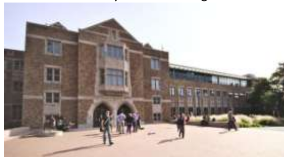
Husky Union Building

学生活动中心全称为 Husky Union Building。整座楼功能非常的健全，这里不仅有书店、便利店、各种餐厅，还有教室、活动室、电脑房等。