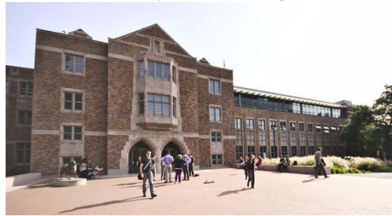
Husky Union Building

学生活动中心全称为 Husky Union Building。整座楼功能非常的健全，这里不仅有书店、便利店、各种餐厅，还有教室、活动室、电脑房等。